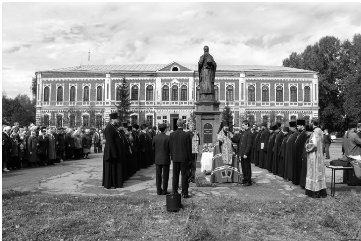
Молебен у памятника святителю Макарию Алтайскому. На заднем плане – здание бывшего Бийского миссионерского катехизаторского училища. 18 сентября 2010 г.

Вслед за этим было возгласено многолетие благоустроителям и украсителям храма.