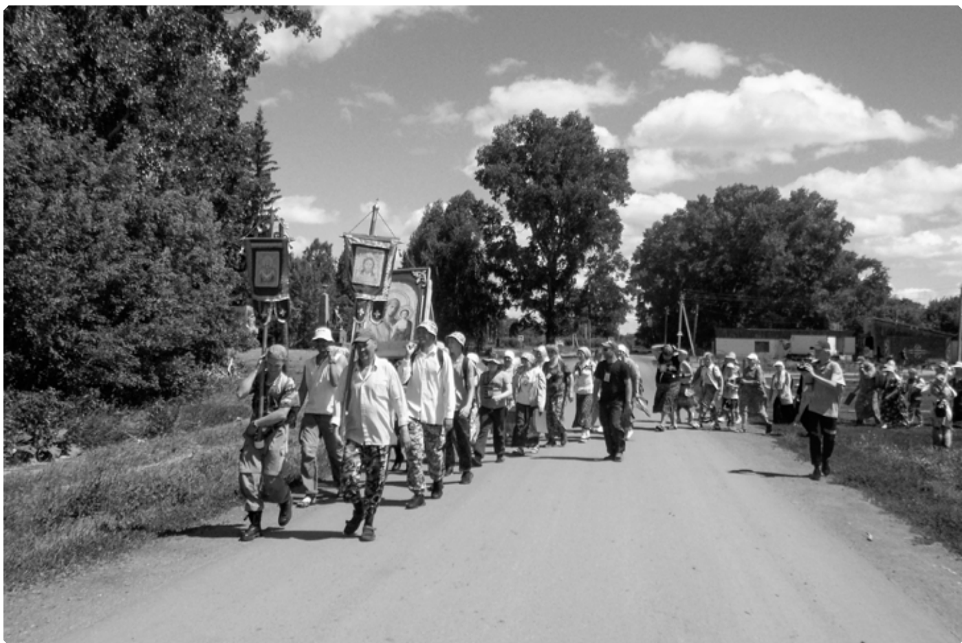
Впереди Быстрый Исток. Село Верх-Ануйское. 28 июня 2022 г.