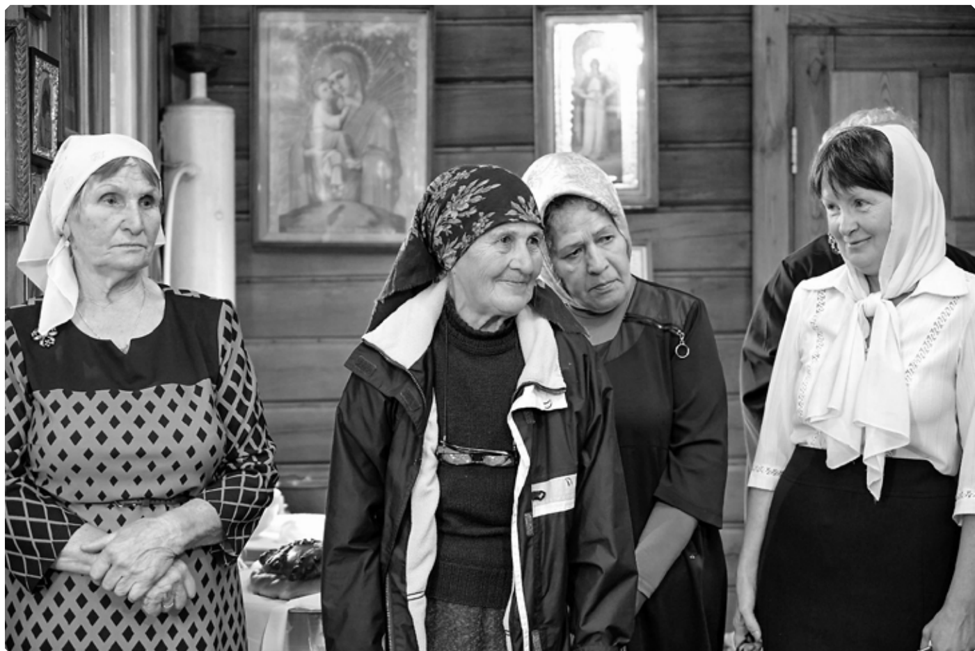
Нижнекаменские прихожанки. Михаило-Архангельский храм. Село Нижняя Каменка. 19 сентября 2021 г.

Недостающее количество учебников, учебных пособий было пополнено частью на средства Епархиального училищного совета и местного попечительства, а частью на пожертвования попечителя школы. Старые парты были заменены более приличными и прочными. Вообще школа прекрасно поместилась в нижнем этаже здания и приняла настоящий свой вид. Отопление и предоставление прислуги для школы приняло на себя местное общество. Верхний этаж приспособлен для богослужений. Их отправление по праздничным дням было начато с первого года существования школы и поставлялось в обязанность учителя, но если бывшее помещение не могло удовлетворить и школьным потребностям, тем более могло ли оно служить удобным местом для молитвенных целей?!