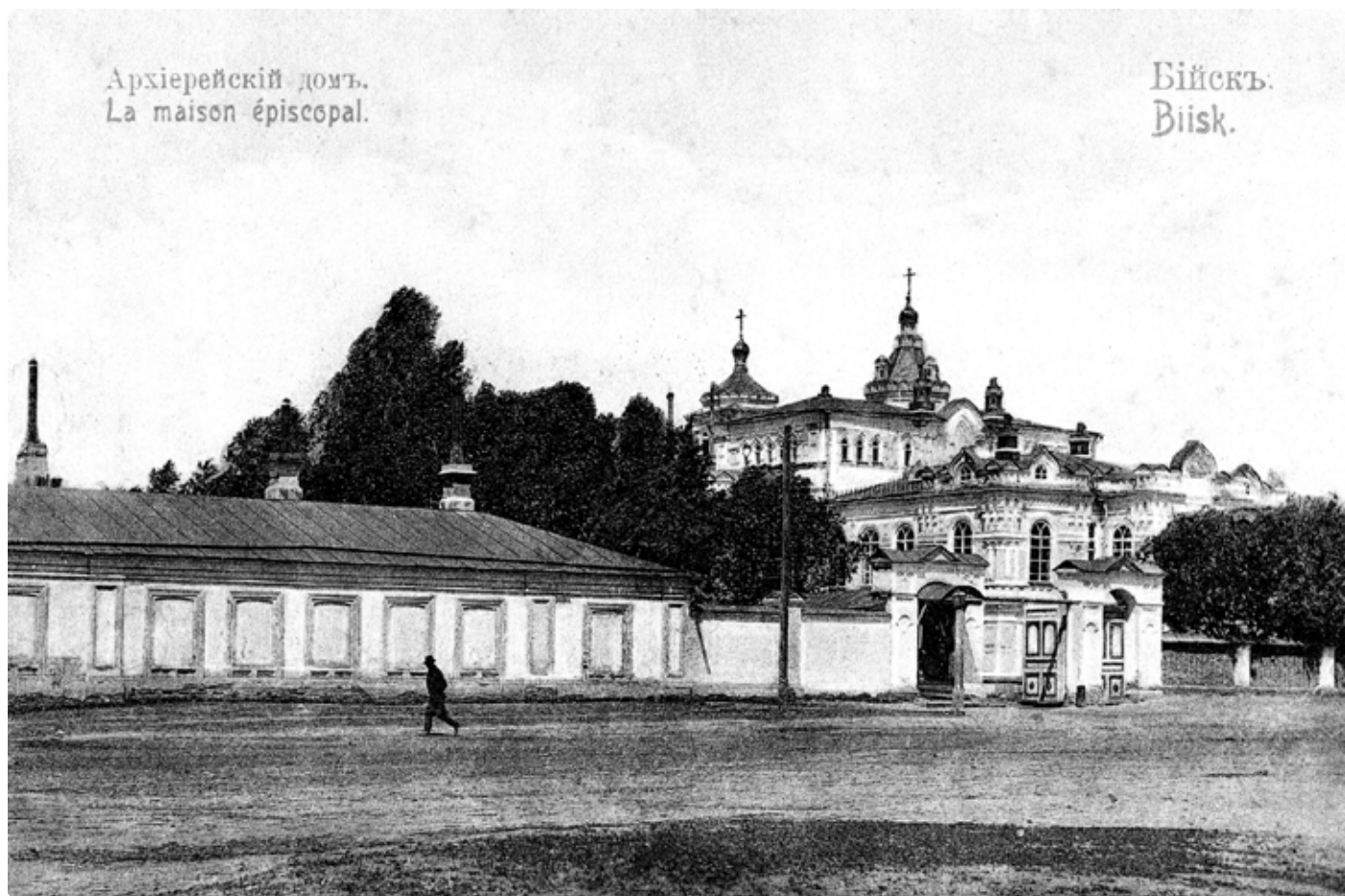
Бийский архиерейский дом – резиденция начальника Алтайской духовной миссии. Начало XX в. Почтовая карточка.

“кто прибавит или убавит, да будет проклят”. Сотрудник ( противораскольнического братства. – ред. ) показал из старопечатных книг не только разных, но и одного и того же “выхода”, множество разногласий, так что Черкасов вынужден был признать, что “действительно это обретается”. Некоторые из старообрядцев к беседам и наставлениям сотрудника отнеслись равнодушно. Один ссылался на предков, “которые не меньше их знали”. Другой говорил: “не ходи, не смущай меня, а то гонять тебя буду”. Третий заявлял: “Самое бы лучшее и распрекрасное дело было бы – не ходить тебе к нам, а то ходи, не ходи, всё равно не послушаем”...»