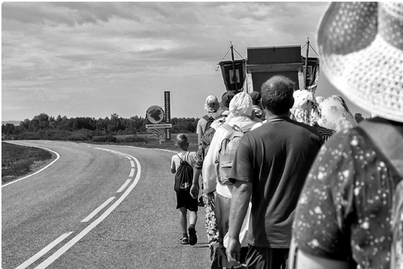
Крестный ход покидает Смоленский район. 27 июня 2022 г.

Миновав Хлеборобное, мы по мосту пересекли Ануй, перейдя с его правого берега на левый, и вскоре вошли в село Верх-Ануйское. Оно возникло немногим позже Ануйского, в 1760-е годы, как поселение отставных солдат, служивших на военной линии, и поначалу считалось древней. Поскольку находилась она выше Ануйской крепости по течению реки, то и называли ее Верх-Ануйской, хотя до верховьев Ануя отсюда очень далеко. В начале XX века в селе было два действующих православных храма: Никольский и Троицкий, разрушенные впоследствии. Современная церковь Святой Живоначальной Троицы возведена совсем недавно. Инициатором возрождения храма стала семья Руссу из Молдавии. Жизнь этой семьи оказалась тесно связанной с Верх-Ануйским в послевоенные годы ( подробный рассказ о церковной истории этого села и строительстве нового храма можно