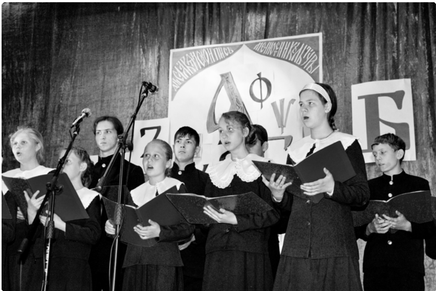
День славянской письменности и культуры в стенах Бийской православной гимназии. 24 мая 2009 г.

затворились церковные двери, настала тишина и только отзвуки радостного Рождественского тропаря, как-будто бились еще, трепетали и тихо замирали в высоком куполе храма, да из-за двери доносились неясные звуки читаемых молитв и возглашений. Вот, наконец, торжественно и стройно прозвучали слова священного псалма: «возьмите врата князи ваша», вспыхнули и вдруг загорелись свечи в золоченных люстрах, сверкая бриллиантами в хрустальных подвесках; народ замер в трепетном и благоговейном ожидании; раскрылись двери, процессия снова показалась и стройно проследовала в святой алтарь; провожаемая множеством умиленных, восторженных взоров.