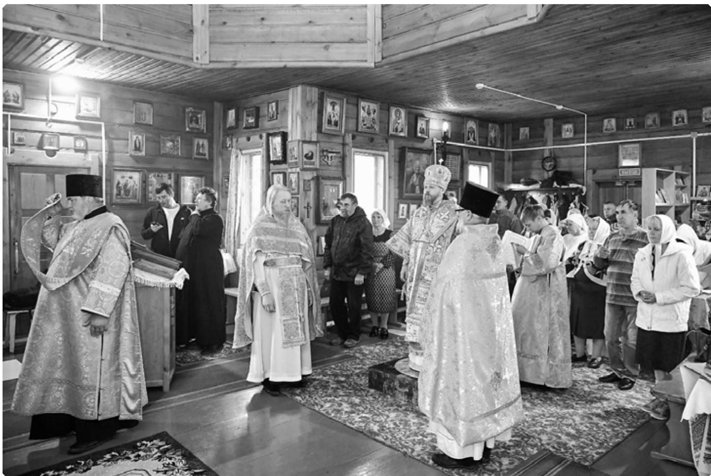
Архиерейское богослужение. Храм Архангела Михаила. Село Нижняя Каменка Алтайского района. 19 сентября 2021 г.