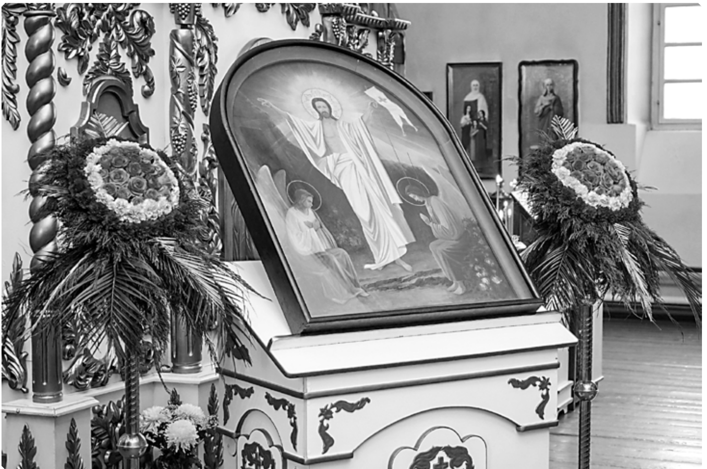
Икона «Воскресение Христово». Храм Казанской иконы Божией Матери. Город Бийск. Пасха Христова. 2023 год.

На протяжении двух тысячелетий именно этими словами Святая Церковь торжественно возвещает людям благую весть о дарованном Богом спасении. В них – огонь нашей веры, сила любви, основание надежды, краеугольный камень Церкви, средоточие новозаветного послания миру, немеркнущий свет просвещения и источник вдохновения, сердцевина христианской жизни и вся наша будущность.